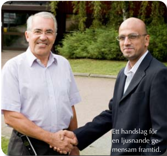
Ett handslag för en ljusnande gemensam framtid.

Med nya ägaren i ryggen siktar Krafterelektronik högre än någonsin. Företagens produkter kompletterar varandra och tillsammans uppnår man global marknadstäckning.